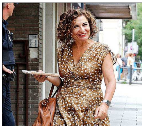
María Jesús Montero, ministra de Hacienda.

figura tributaria que también contribuyó a engordar la recaudación. En los primeros siete meses del año, esta figura tributaria ha aportado 69.160 millones de euros, un